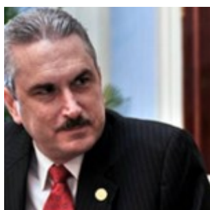
Thomas Rivera Schatz

“La Junta de Gobierno de la AEE debe atemperar el sueldo a lo que estoy planteando, o en su defecto, los miembros que no estén dispuestos a hacerlo deben renunciar a sus cargos, para que los asuman personas que trabajen arduamente en la búsqueda de un buen director ejecutivo dispuesto a trabajar por un salario que se ajuste a la realidad de la AEE”, dijo Rosselló Nevares en declaraciones escritas.